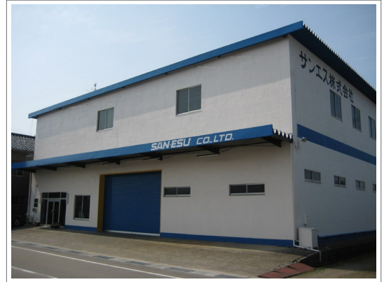
本社・第 1・第 2 工場